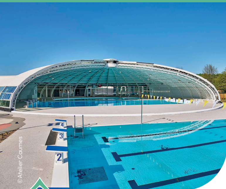
Un bassin nordique et bassin sportif