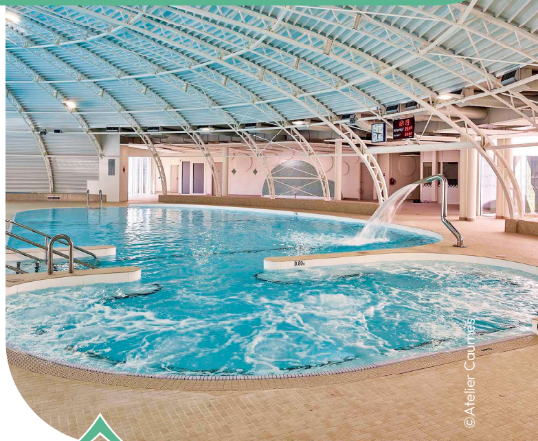
Un bassin ludique